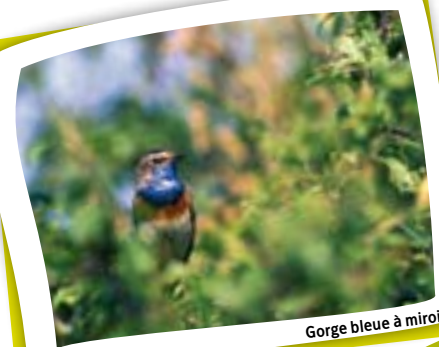
Gorge bleue à miroir

4 ZHIB ont à ce jour été désignées par le Gouvernement wallon sur le territoire du Parc naturel des Plaines de l'Escaut (elles sont intégrées au réseau Natura 2000) : les trois coupures de l'Escaut de Bléharies, Hollain et Bruyelle (22,5 ha) et le complexe des Marais d'Harchies-Hensies-Pommeroeul (554 ha). ■