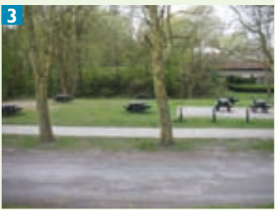
Aménagements pour les promeneurs