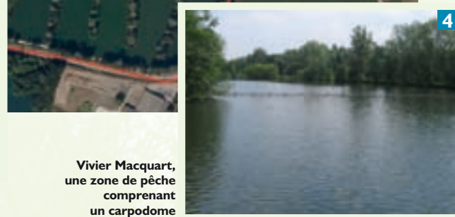
Vivier Macquart, une zone de pêche comprenant un carpodome