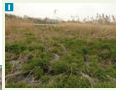
Une roselière à fort potentiel écologique