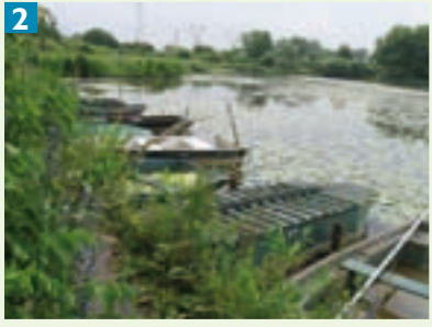
Parc à barques pour la pêche et la chasse