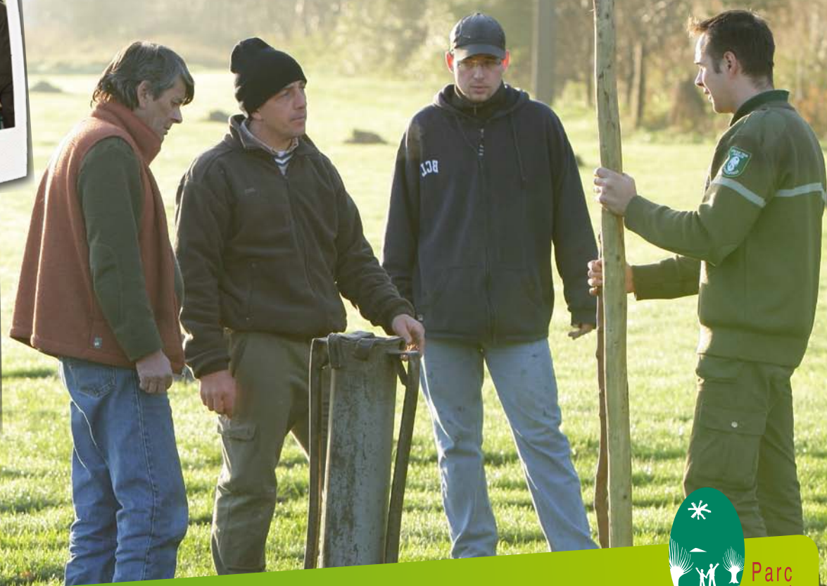
Photos : S. Dhote, D. Delecourt, G. Smellinckx, PNRSE / Conception graphique : PNR Scarpe-Escout / @Parcnaturelregionalscarpe-escout - avril 2019