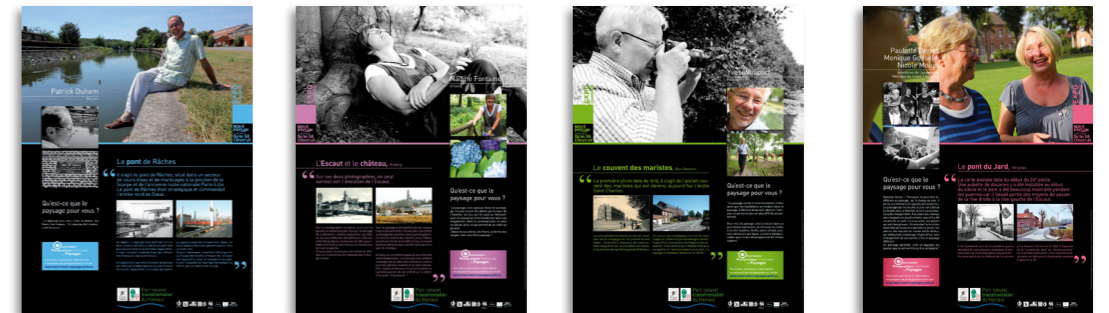
20 panneaux rigides de 0,8m x 1m à suspendre (sur grilles par exemple).

Photographiés par Samuel Dhote, 20 habitants témoignent de l'évolution de leurs paysages. Réalisée dans le cadre de l'Observatoire photographique transfrontalier des paysages, cette très belle exposition est composée de 20 panneaux à présenter ensemble ou individuellement.