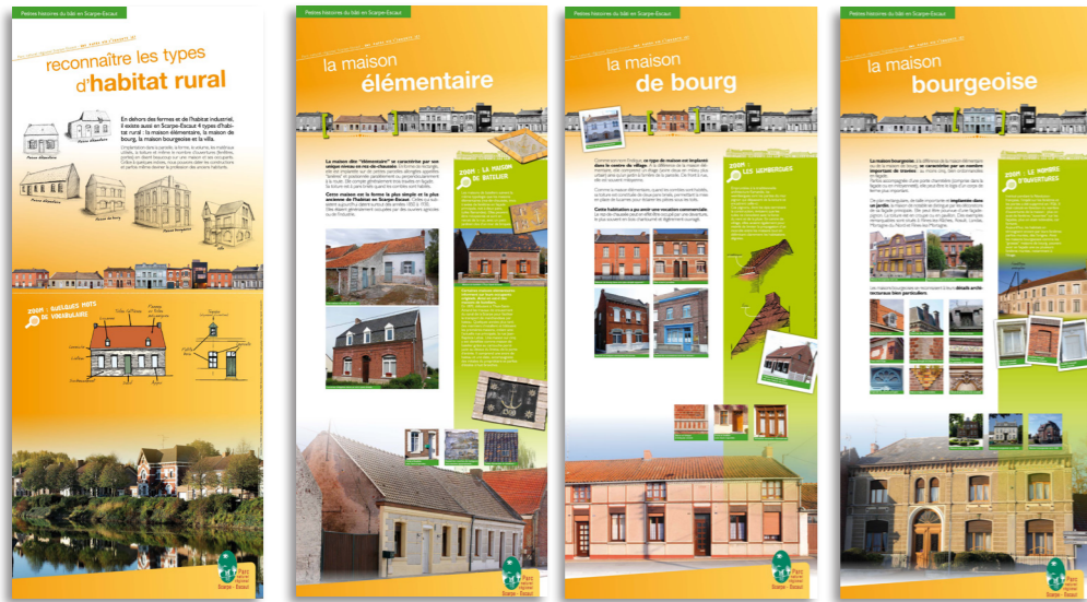
11 et 8 bâches de 0,80 m x 2m (roll up). Chaque partie est accompagnée d'un livret pédagogique.

Superbement illustrée et très complète, cette exposition valorise les patrimoines bâtis de vos communes. Une première partie explique les matériaux traditionnels et les formes architecturales... Une seconde partie relate les différents types d'habitat locaux. Entre grande Histoire et anecdotes, voici une exposition très riche ! Un livret pédagogique complète l'exposition.