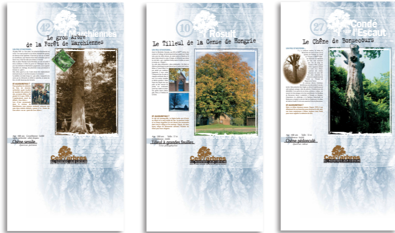
11 bâches de 0,8 m x 2m (roll up).