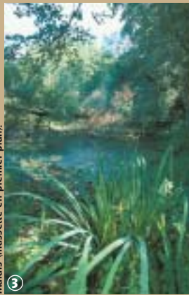
Marais (massette en premier plan).

La Chasse Napoléon est une majestueuse allée de peupliers de plus de 20 mètres de haut. Les adjectifs ne manquent pas pour qualifier cette voie royale, empruntée par les trou-