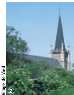
Village de Vred