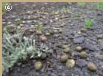
Traces de lapins sur le terril

Le lézard des murailles trouve aussi en ces lieux la chaleur et les insectes nécessaires à son développement. Si tout ce petit monde vit en symbiose dans cet environnement, pourquoi pas vous ? Cheminez donc sur le terril, vous découvrirez un nouveau monde !