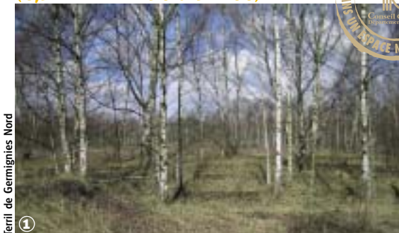
Terril de Germignies Nord