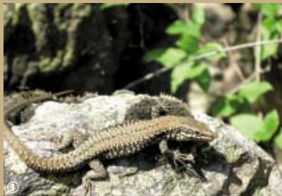
Lézard des murailles

Ceux qui pensent que les terrils enlaidissent le paysage se trompent !