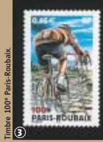
Timbre 100€ Paris-Roubaix.

Quel pied de nez les pavés font-ils à tous leurs détracteurs ! La valorisation du patrimoine est dans l'air du temps et les pavés en sont les premiers bénéficiaires. Des sections entières sont désormais classées sur plusieurs kilomètres ; certaines portions sont réhabilitées voire créées pour assurer la continuité de la route. Pourtant la partie n'était pas gagnée. Si l'aménagement de