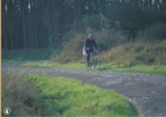
La petite Reine sur les pavés.

chemins pavés au début du XIX e siècle – pour la commune de Vicq – fut considéré comme un réel progrès face aux chemins de terre qui s'embourbaient dès la première pluie, les pavés ne sont-ils pas depuis plus de 100 ans assimilés à l'Enfer du Nord ?