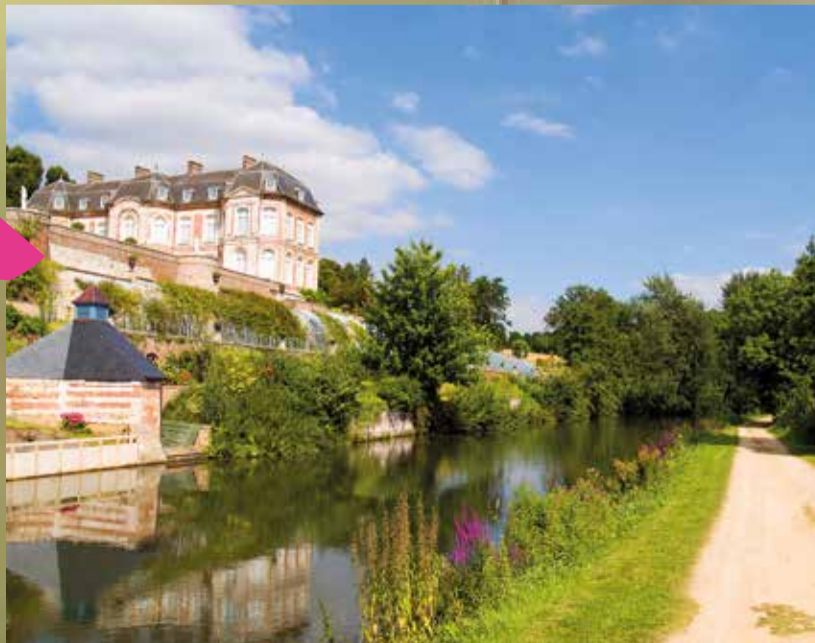
BAIE DE SOMME-PICARDIE MARITIME