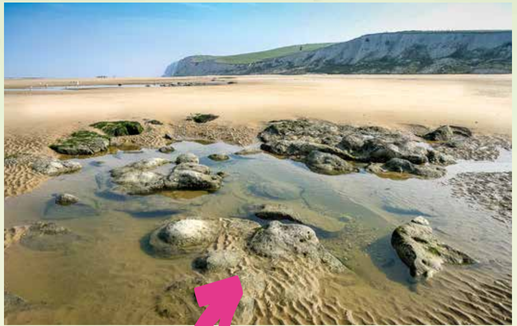
CAPS ET MARAIS D'OPALE