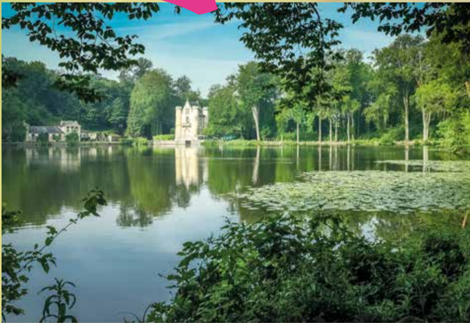
OISE-PAYS DE FRANCE

Les 5 Parcs naturels représenteront 13% du territoire et des habitants des Hauts-de-France.