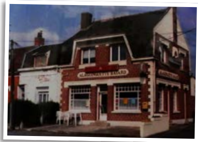
Cette guinguette Bayard a cessé définitivement son activité en 2004

Cependant, vers la fin des années 1970, le quartier s'est vidé, car fragilisé par la récession minière et sidérurgique, mais également condamné par la disparition des exploitants et l'absence de repreneur !