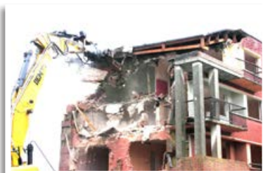
Démolition du bloc Alsace en octobre 2013

Depuis les années 1980, on commence à détruire des immeubles. Le premier à être détruit est le bloc Million car il était en très mauvais état. Sur la photo, c'est le seul bloc qui est isolé à gauche près de la cité.