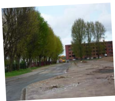
le Faubourg Duchateau en pleine mutation !

Nous avons commencé par définir la notion de paysage comme une partie d'un territoire perçu par la population, et qui est modifié par l'action de la nature et de l'homme au fil du temps.