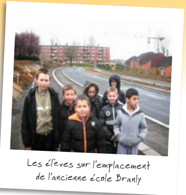
Les élèves sur l'emplacement de l'ancienne école Branly

Les deuxièmes écoles construites sont les écoles maternelles. Ce sont les écoles Sévigné et Branly. Depuis 2012, l'école Branly a été démolie dans la rue de l'abbé Bourgeois. Elle se trouve maintenant dans la cour de l'école Sévigné.