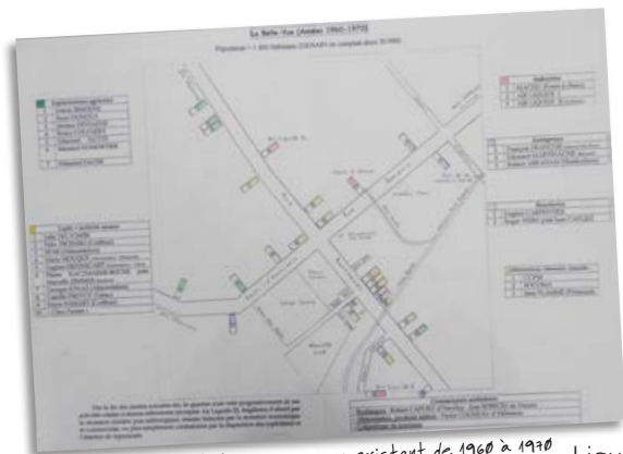
Emplacement des commerces existant de 1960 à 1970