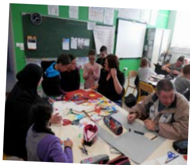
Avec les parents d'élèves !