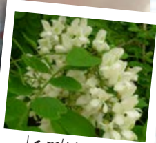
Le robinier ou faux acacia !