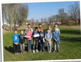
Les élèves sur l'emplacement de l'ancienne école Condevaux

La 3ème école élémentaire a existé de 1960 à 1995. Elle était derrière le pavillon Dauphiné. Elle s'appelle l'école Condevaux. Elle accueillait les garçons. Les filles allaient de l'autre côté du bâtiment, dans l'école Jean Zay. De ces 6 écoles, 3 sont encore en service.