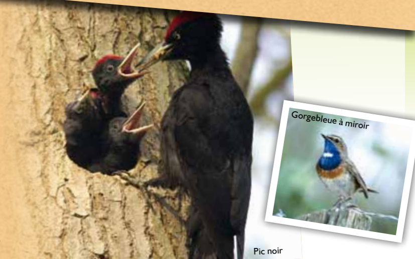
Gorgebleue à miroir Pic noir

du 2 avril 1979 (devenue directive 2009/147/UE, suite à la modification du 30 novembre 2009), concerne la conservation des oiseaux sauvages. Les sites désignés au titre de cette directive sont appelés "Zone de Protection Spéciale" (ZPS). Ce sont des sites maritimes ou terrestres d'importance pour la survie et la reproduction d'espèces d'oiseaux sauvages d'intérêt européen (zones de reproduction, de mue, d'hivernage ou de zones de relais pour les oiseaux migrateurs). Une liste des espèces concernées est fixée par arrêté du ministre en charge de l'environnement pour chaque site.