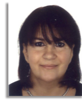
Odile Cheuva Centre de ressources Photothèque Site internet