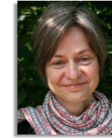
Morgann Le Mons Paysage