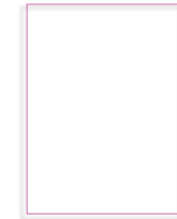
Claire Gageonnet Plan Paysage